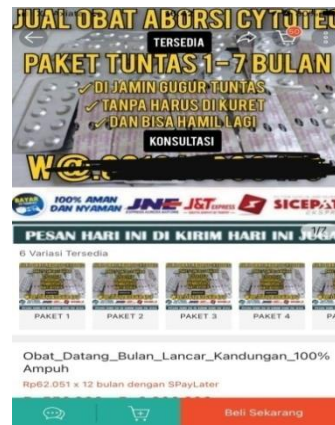
gambar 2 dan 3 : tampilan akun penjual obat cytotec

Dari banyaknya akun yang menjual obat cytotec ini, penulis mengambil 3 akun yang diwawancarai. Berikut hasil wawancara penulis dengan penjual: